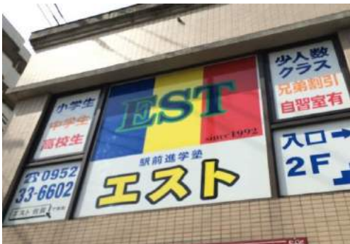
佐賀駅バスセンターより徒歩1分